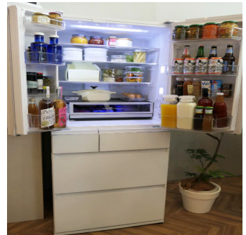
冷蔵庫で食品の保存ができ、明るい場所で食事ができます。