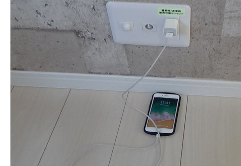
非常用コンセントを使用することで携帯電話の充電が可能です。