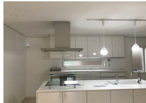
いざという時の避難もスムーズにでき、安心感と安全性を確保できます。